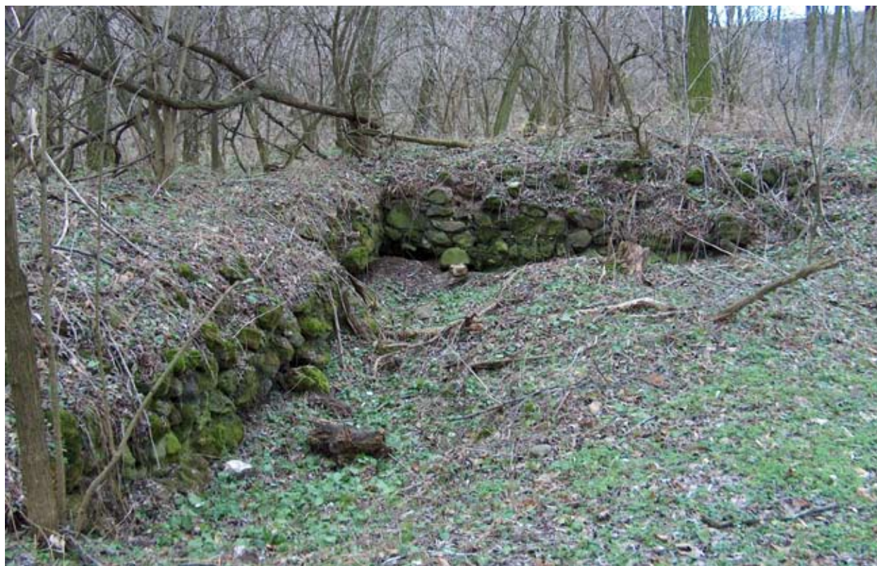
Az apátság még feltáratlan romterülete