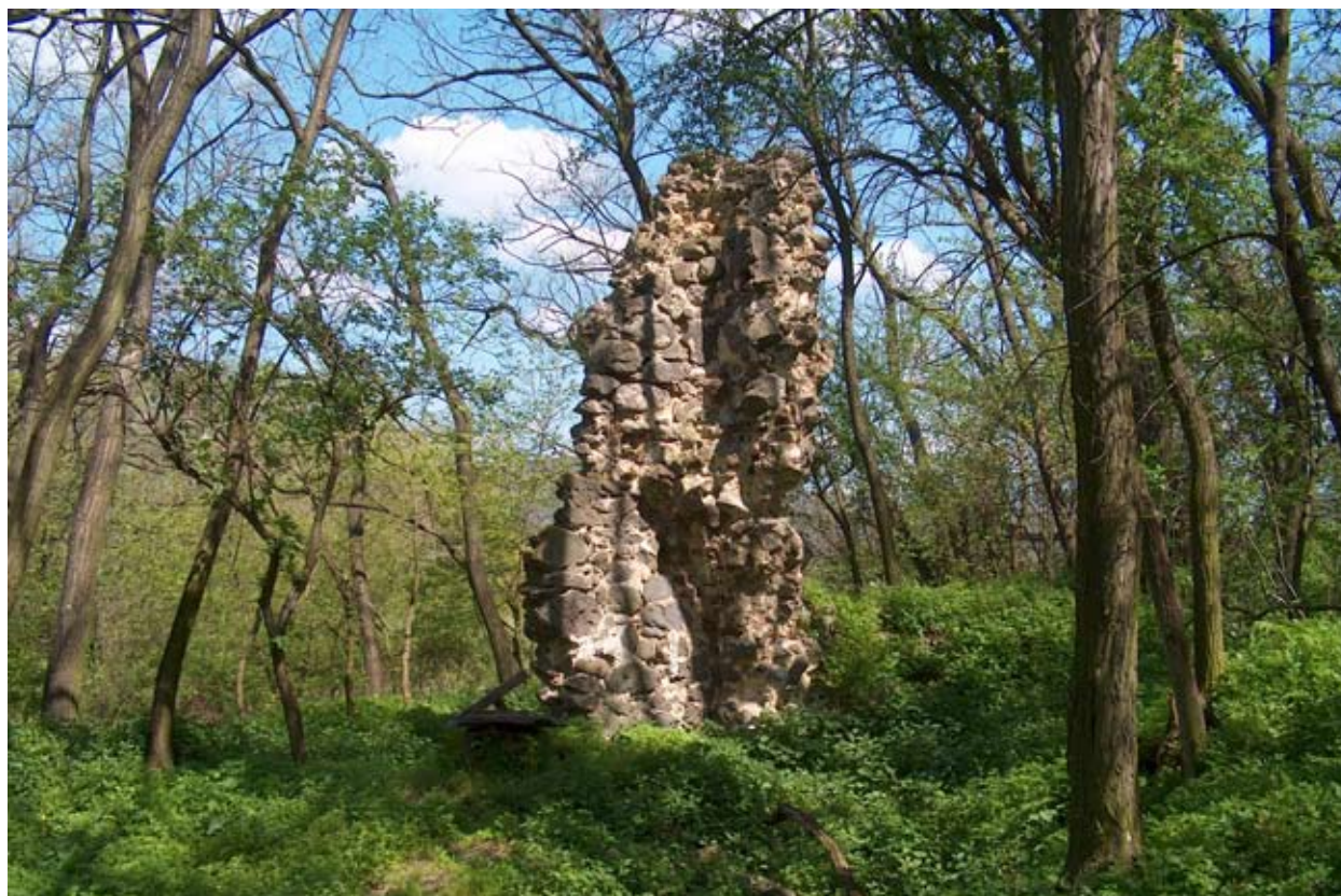
A kolostor északnyugati, legépebben maradt falcsónkja

Hazánkban a XII. századig tartó gyakorlat szerint csak az uralkodók, az érsekek és a püspökök alapítottak kolostorokat. A XII. század elejétől egyes világi előkelők is szerzetesi egyházalapításba fogtak és példájuk követésre talált. E magánkegyúri apátságok elő- és mintaképeül a német Eigenkirche szolgált. A világi főúr általában a saját birtokközpontjában építtette fel magánmonostorát, azt tartozékaival, hozzá rendelt birtokaival, javadalmaival egyetemben saját tulajdonaként kezelte. E monostorok szerzetesi közösségének előljáróját, az apátot az alapító, később a fenntartó kegyúr helyezte méltóságába és iktatta be javadalmaiba, az illetékes megyéspüspök csak a szerzetesi egyház felszentelésének és ellenőrzésének jogával bírt.