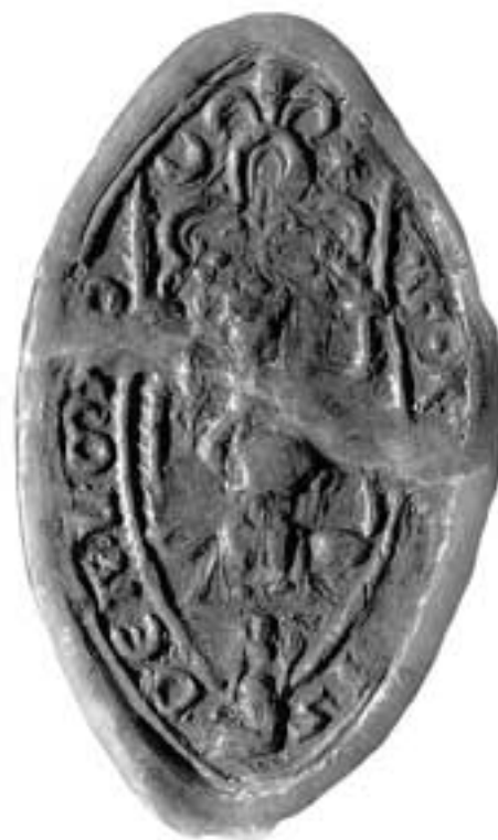
Az apátság pecsétje

Az almádi apátság utóbbi egy évben bejárhatóvá tett rommezeje azonban mégis sok mindent megmutat. Ami biztosnak látszik: mindenképpen háromhajós, háromszentélyes, kettős nyugati homlokzati toronnyal és előcsarnokkal épült egyház volt. A főszentélyt borító magas omladékhalom nem teszi lehetővé annak eldöntését, hogy az félköríves vagy egyenes lezárású volt-e? Az azonban egyértelműen megfigyelhető, hogy a mellékhajók egyenes külső zárófalú és egyenes belső lezárású elrendezéssel épültek. Az emeletes lakónégyszög a monostortemplom északi oldalához csatlakozott. A nyugati szárny az egyértelmű alapincézetség nyomait mutatja. A quadrum északnyugati sarkán álló