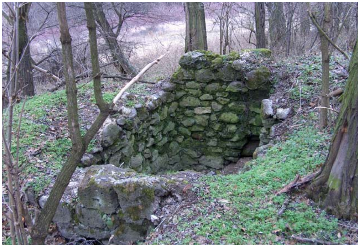
A kolostor északkeleti része