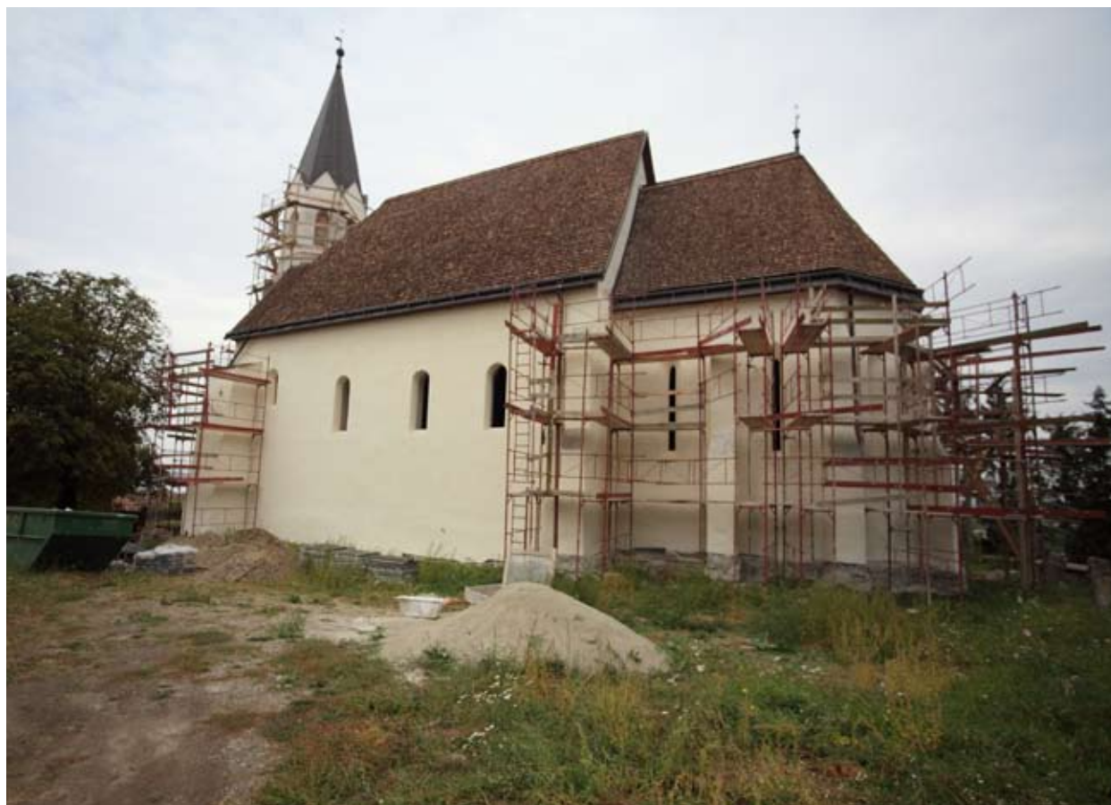
A templom 2012 őszén

Abaúj megyei birtokközpontjává kívánta tenni, ugyanis 1399-ben a birtokra várépítési engedélyt kért a királytól. Az engedélyt 1405-ben megerősítette. Ezt követően azonban elállt tervétől, mert 1406-ban a közeli Nagyidára (ma: Vel'ká Ida, Szlovákia) kért és kapott várépítési jogot. Nagyidán a vár valóban felépült és Abaújvár ezt követően a nagyidai uradalom faluja lett, s kisebb megszakításokkal a Perényi család ezen ágának birtokában maradt a következő évszázadokban.