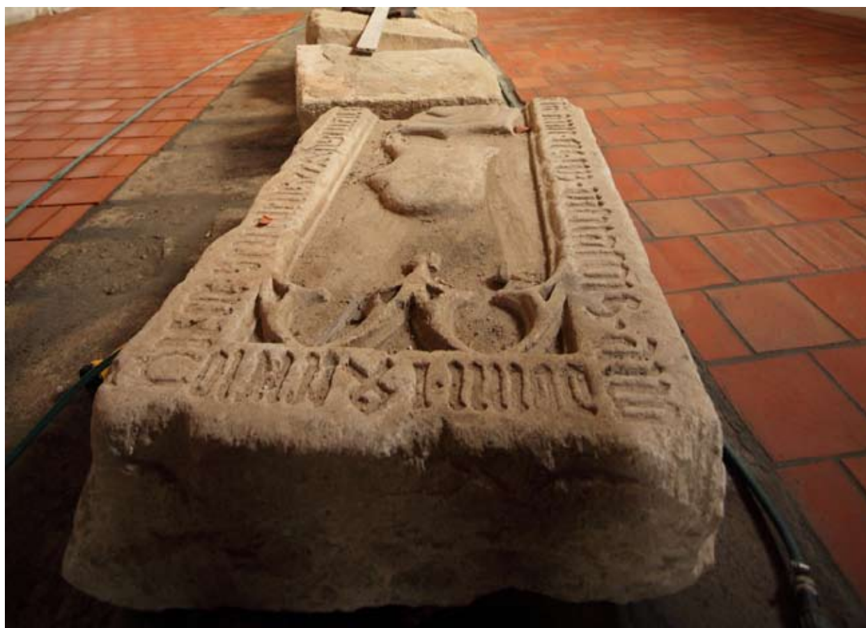
A sírkő a templom hajójában ideiglenes helyén, egy évvel ezelőtt

Az abaújházi református templomban 2008-2009-ben folyt régészeti kutatás során a hajó közepén a kőburkolatban lefelé fordítva beépített középkori sírkövet találtunk. A lelet a felirat évszáma és a művészettörténeti datálás közötti jelentős eltérés miatt több azonosítási és datálási problémát vetett fel. A sírkőről a felfedezés idején több fórumon hírt adtunk, és szerepelt a kutatásról közzétett előzetes összefoglalásokban. Hogy kinek készülhetett a sírkő és mikor, arról akkor csak igen szűkszavú megállapításokat közölhattünk. Ma a háttérinformációk alapos összegyűjtésével sem tudunk biztosan mondani, de ennek alapján közelebbről határozhatók meg az értelmezés történeti keretei és háttere, melyek feltétlenül tanulságosak.