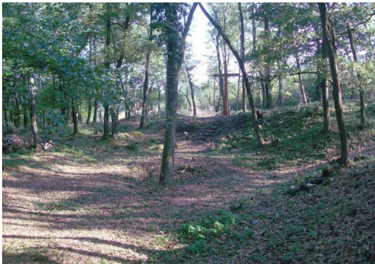
Az apátsági templom főhajója napjainkban