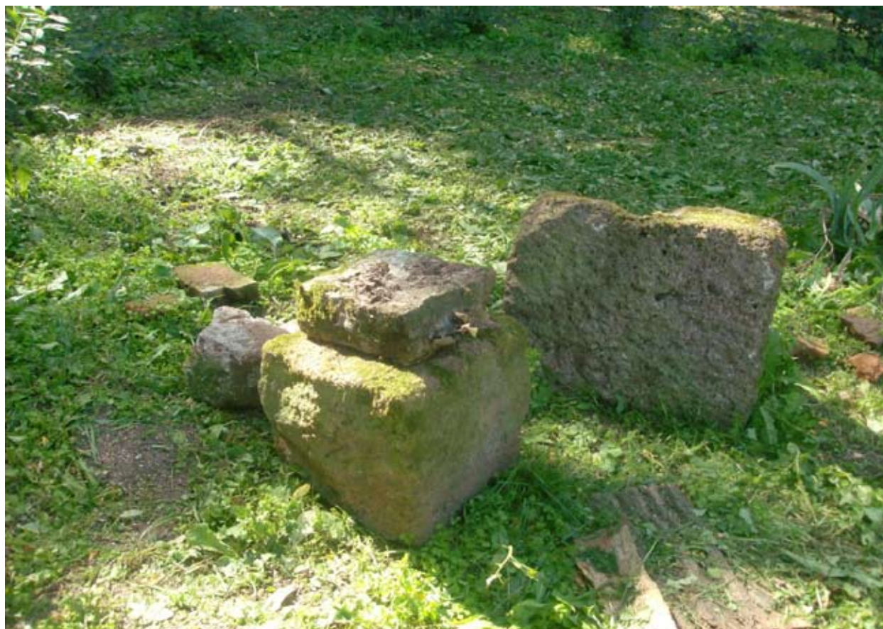
Kváderek a quadrum területéről (a szerző felvétele)