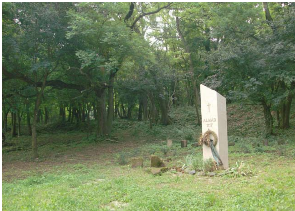
A kolostornál 2005-ben állított emlékmű