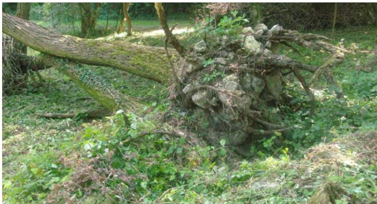
A falmaradványokat pusztító növényzet hatásaiból

Ilyen eseményektől színezve ért végét az almádi apátság fennállásának harmadik évszázada, amelynek a fényes mellett voltak ugyan árnyékosabb oldalai is itt az Eger-völgyben. De ideszámítva a jelen fejezetben nem taglalt hiteleshelyi tevékenységet és oklevélkiadási gyakorlatot, a tekintélyes és elhivatott apátok sorát; összességében méltán tekinthető e század a kolostortörténet valódi „aranykorának.”