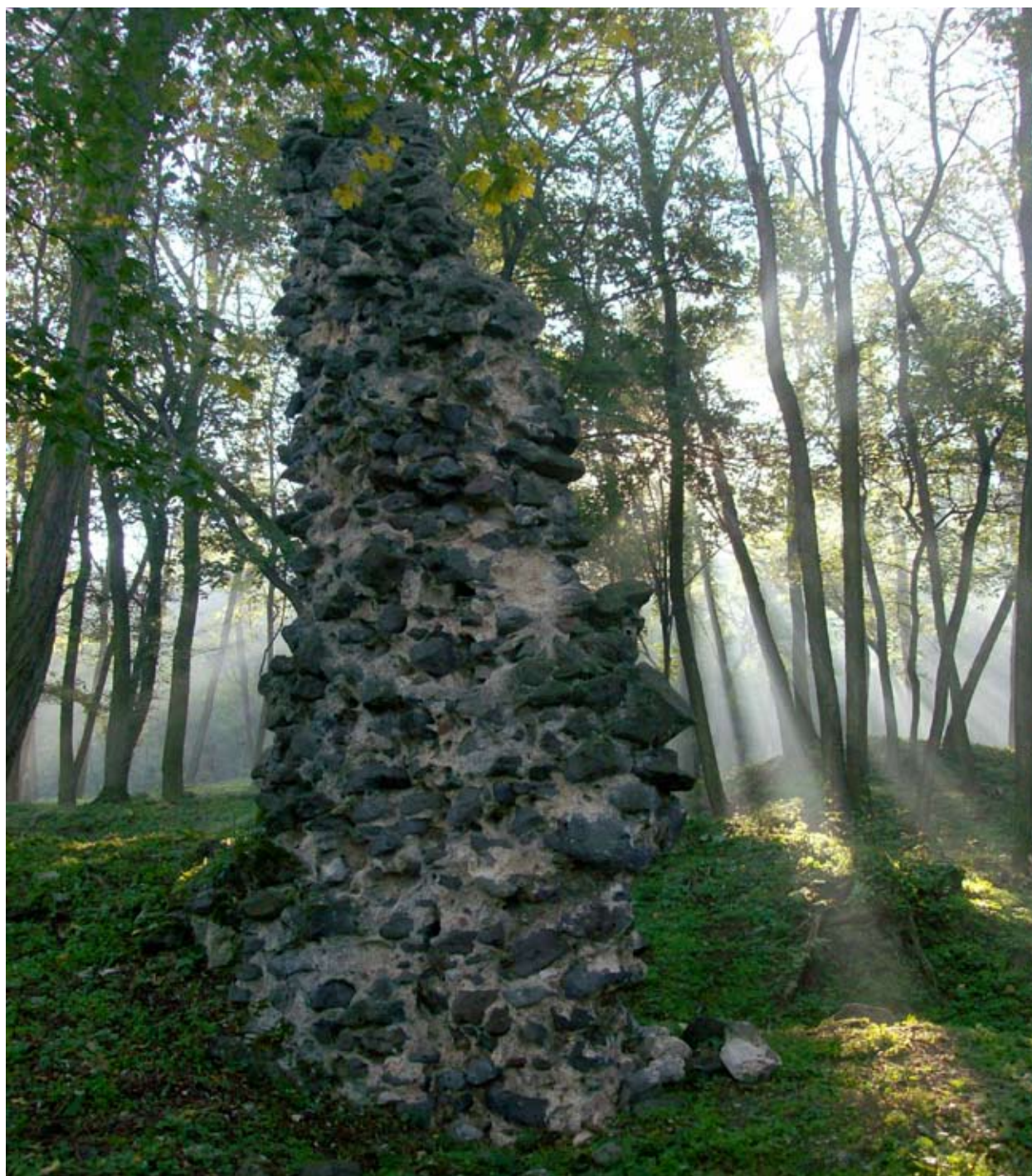
Az északnyugati sarok falcsontja (a szerző felvétele)

bort. Kiegészítő büntetésként a perköltségek és kamatok fejében még további 80, új forintban fizetendő pénzbírságot is kivetettek rá. Minderre 30 napot kapott, amelyeket ha nem teljesít, akkor az egyházi kiközösítést vonja magára. 5 A határidő leteltéig Péter prépost egyik feltételt sem volt hajlandó teljesíteni, így a veszprémi székesegyházban nyilvánosan kiátkozták. Az eljárásban László apát mellett egy másik hiva-