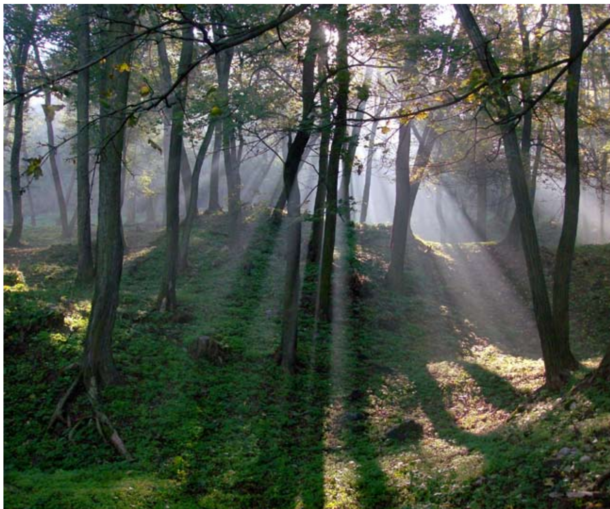
A feltehetően alapincézett nyugati lakószárny reggeli verőfényben (a szerző felvétele)

„Az ökoljog uralma e kor.” E szigorú szakokkal jellemzi a tájegység XV. századi történelmét Emresz Károly; A Tapolcai-medence című tájféldrajzi tanulmányában. Az 1937-ben megjelent munka egyben a szerző doktori értekezése volt a Magyar Királyi Ferenc József Tudományegyetemen. 1