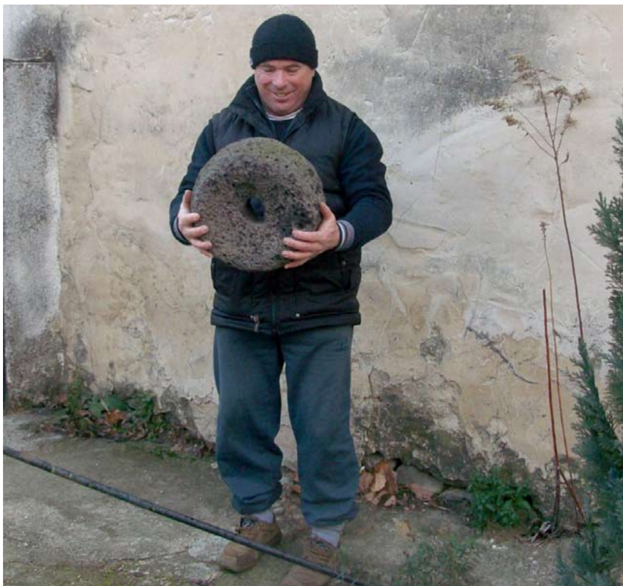
Kézimalom az apátsági lakóépület keleti szárnyának területéről