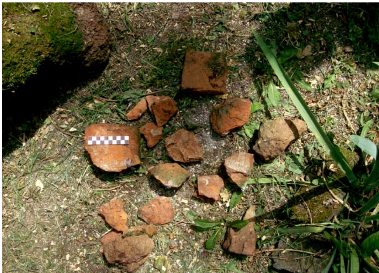
Téglatöredékek a quadrum területéről

példátlan jogsértésként, Berky várnagy a saját papi rokonát helyezte önhatalmúlag az almádi apáti tisztségbe, a letett Pál apátot pedig fogolyként magával hurcoltatta Szigligetbe. Így lett Berky Jób klerikus - ugyan rövid időre - Almád 28., s egyben első és utolsó törvénytelen apátja. 16 A támadás országos méretű felháborodást idézett elő, és maga IV. Jenő pápa is kénytelen volt beleavatkozni az ügybe. 1442. január 30-án, Firenzéből utasította Széchi Dénes esztergomi érseket, hogy folytasson le vizsgálatot, és az érintetteket büntesse meg, Pál apátnak pedig szerezzen jóvá- és elégtételt. Berky Flórist és bűntársait az érsek egyházi kiközösítéssel büntette és a szózott halakig bezárólag minden elrabolt ingóság hiánytalan visszaszolgáltatására kötelezte őket. 17