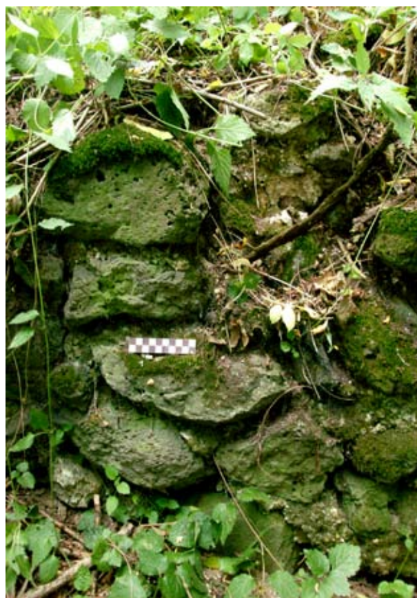
Felmenő fal részlete a keleti lakószámban

A felvonult fegyveres csoport bedöntötte a kolostorkaput, Pál apátot foglyul ejtették, majd az egész épületegyüttest, annak minden zugára kiterjedő figyelemmel teljesen kifosztották. Nem kímélték az éléstárakat, az edénykészletet, a borospincét, a fegyvertárat, a könyvtárat és az irattárat sem. Sőt még a kolostor melletti halastavak lehalászására is volt gondjuk. Ezután