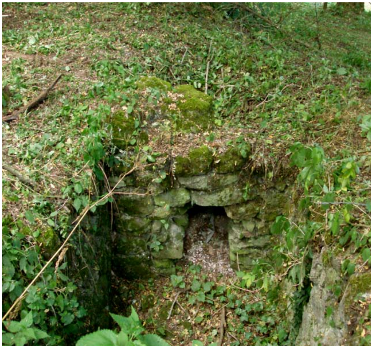
A feltételezett kolostori latrina