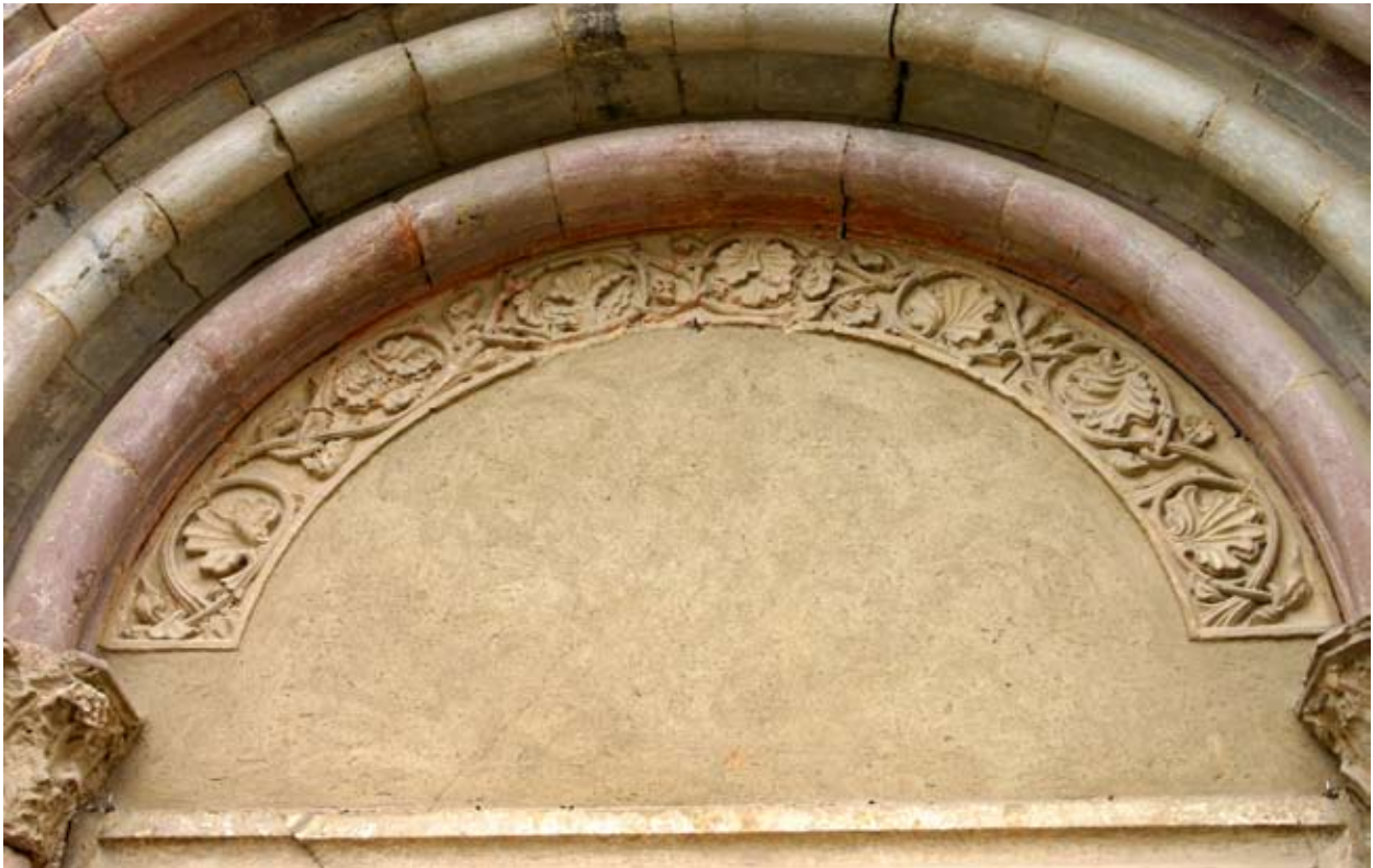
9. kép Bélapátfalva, a nyugati kapu ívmezeje