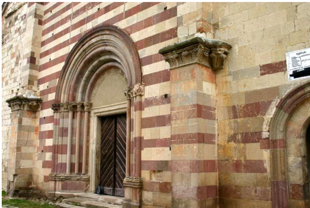
2. kép Belpátfalva, a nyugati sávozott homlokzat a kváderfestéssel

főhajófal gótikus, erről jelenleg nem sokat lehet tudni. Az épület ekkoriban még boltozat nélkül állhatott, majd 1246-ban történik említés a templom Szent Tamás kápolnájáról. 5