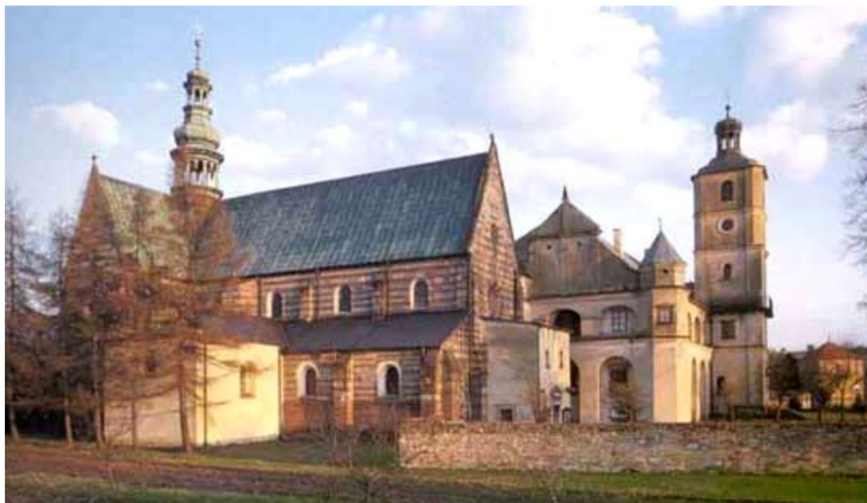
3. kép Wachock, az apátság északnyugat felől

ti homlokzat tekintetében is. 9 A keleti falazatok lábazati részének kutatására, leírására Valter Ilona régészeti feltárása és a szentély mögötti szintösszeállítás után, 2004 őszén kerülhetett sor. 10 Azóta falkutatást csak a sekrestye külső homlokzatán sikerült végezni.