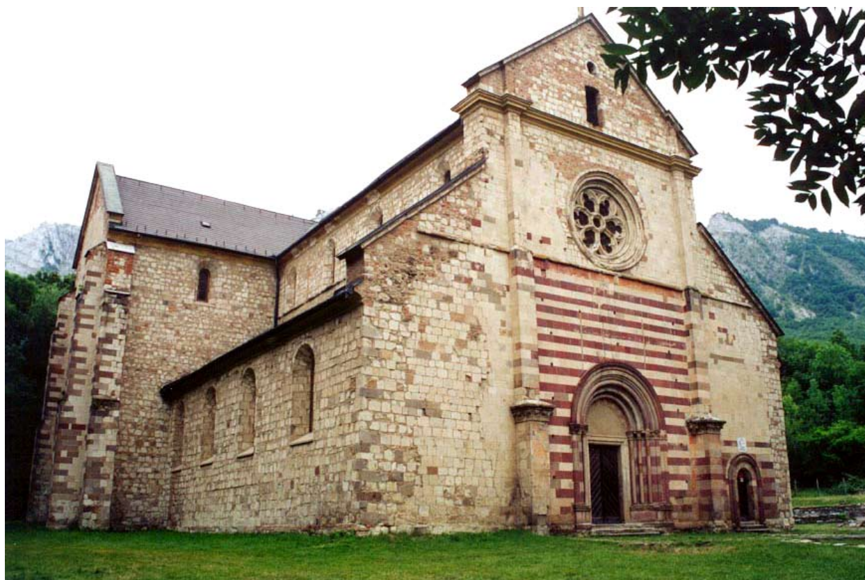
1. kép Bélapátfalva, az apátsági templom északnyugatról

A bélapátfalvai apátsági templom (1. kép) nyugati homlokzatának támpillérein és kapuzatain megmaradt színes kváderfestés olyan építéstörténeti kérdéseket vet fel, amelyek érintik az egykori előcsarnok, a feltételezett csigalépcsőtorny kérdését, de sok szempontból a templom alapvető periodizációját is. Felvet olyan kérdéseket továbbá, hogy milyen célt szolgált (ha szolgált) a nyugati homlokzat középmezőjének vörös-fehér sávos díszítése, illetve, hogy miért nem tekintettek befejezettnek egy 13. századi, színes kváderekkel díszített vakolatlan homlokzatot a 14. században.