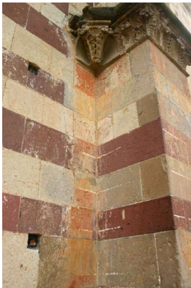
7. kép Bélapátfalva, a déli támpillér

ban eredetileg pillier cantonné típusú támaszai lettek volna. 17 Jellemző erre a periódusra még a tölcserbélletes ablakok eltérő kőkiosztása is: míg a keleti, 13. századi ablakok átboltozása sugárirányba rakott köelemekből áll, a déli főhajó ablakainak átboltozása két réteggel történt. Az első periódushoz képest eltérő építéstechnikára vall a köemelő olló használata, amelynek nyomai fellelhetők az említett ablakokon is.