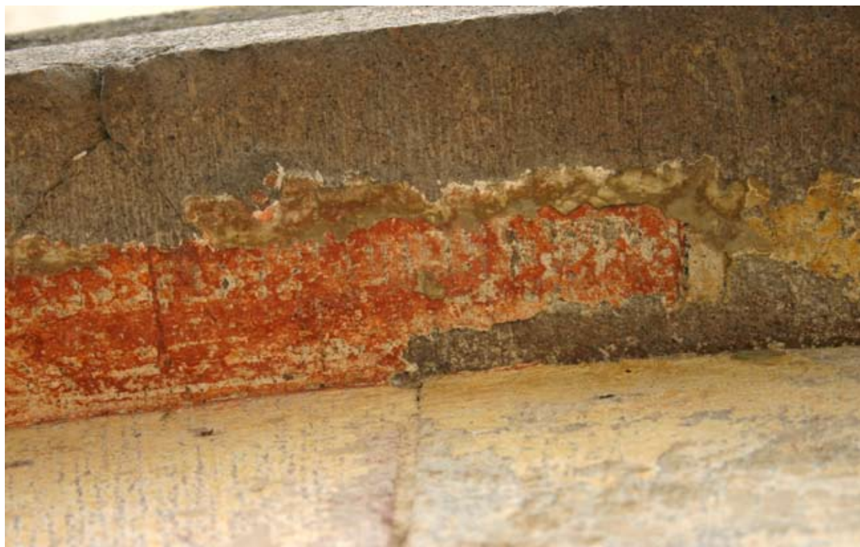
6. kép Bélapátfalva, a conversus -kapu szemöldökén megmaradt festés