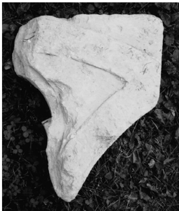
4. kép Bélapátfalva, rózsablak töredéke

Bélapátfalván az első periódusú nyugati homlokzathoz tarozhat egy küllős rózsablak töredéke. (4. kép) A jelenlegi rózsablak mérművei a 14. századi építési periódusból származnak, a rózsablak bélletezése viszont a 13. századi köelemekből lett újrarakva, néhány elemet kihagyva, kisebb átmérővel. Megjegyzendő, hogy az élszedett profilú, orrtagos gótikus mérmű is nagyon nyomottnak tűnik, nem zárható ki hogy a homlokzat 14. századi befejezésekor eredetileg a román korival megegyező átmérőjű ablakot terveztek. A rózsablak töredék homloksíkját egymásba írt félkörös záradéku szalagok díszítik, a két átmetsződés csúcsívet alkot, az ívháromszögek körökkel voltak áttörve. Az említett rózsablak töredékhez köthető még egy kisebb méretű bimbós oszlopféjezet és középgyűrű is. 14