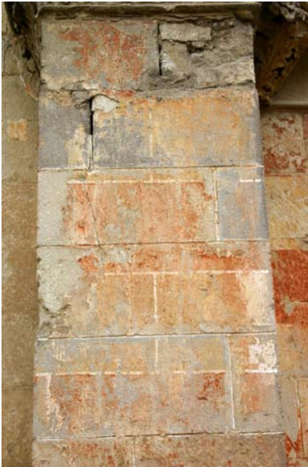
10. kép Bélapátfalva, Az északi támpillér kváderfeszése

festett kváderek díszítették, a kváderek között fehér, festett fugával. (7. kép) A festett fugán viszont sehol sem látszik az árnyékot imitáló fekete csík. A támpilléreket díszítő kváderfestés a támpillérek belső oldalán egy kvádernyi szélességben átfordul a falmezőre. (10. kép) Ez a kváderfestés a nyomokból ítélve felment egészen az övpárkányig, amely sárga festést kapott, alatta vörös okker sáv húzódik, eredetileg talán ezen is lehetett némi osztás. Szabad szemmel nem megítélhető, hogy a nyugati kapu fölötti, a két támpillérrel és övpárkánnyal körbezárt nagy falmezőt tagolta-e valamilyen festett osztás.