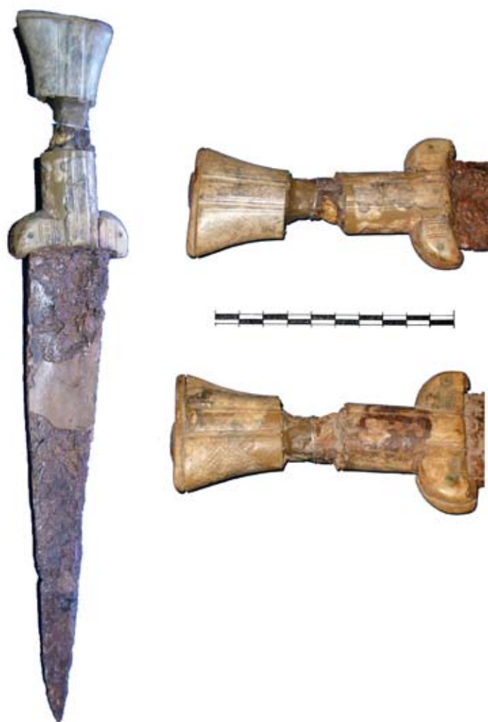
2. Egyélű vastőr az Alsóvárból, 13. század második fele

várnak ezen a részén teraszt hoztak létre. Erre épült fel az a kőépület, amelyet a padlószintről előkerült érmek a 14. század első harmadára datálnak. 11 Az 1968. évi XXI. szelvény és annak folytatásaként a várudvar felé nyitott XXII. szelvény közös tanúfalából került elő az a IV. Béla-kori ezüstdénár 12 amely a kaputorony építéséhez kapcsolódó rétegben feküdt és így biztosan keltezi a torony és az azzal egybeépült völgyzá-