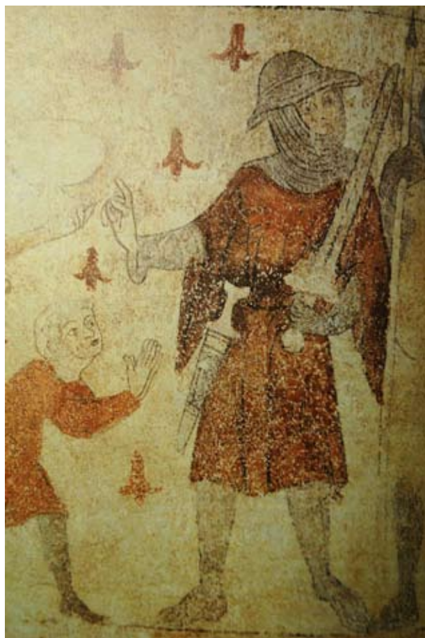
5. Törábrázolás egy zürichi ház falfestményén, 14. század első fele (Stadtluft, Hirsebrei und Bettelmönch. Die Stadt um 1300. Zürich-Stuttgart, 1992.)

gon illusztrált „Flos Duellatorum” 20 a fegyveres és fegyvertelen harc különféle módozatai között a törvívást is részletesen taglalja.