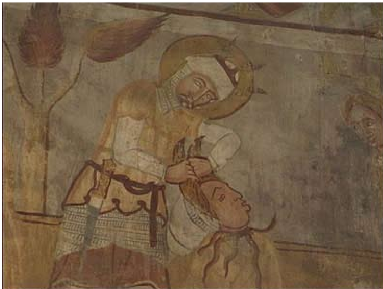
3. Tőrbrázolás a gelencei templom Szent László-legendáján, 14. század eleje. (László 1993. után)

rófal építését a 13. század második felére. 13 Az érem kísérőleletei között bemélyített, körbefutó vonalakkal díszített sötét-és világosszürke, helyenként kormos, Árpád-korinak meghatározott fazéktöredékek, padlótégla-darabok, vascsat, sarkantyú, lóvakaró stb. kerültek elő. 14