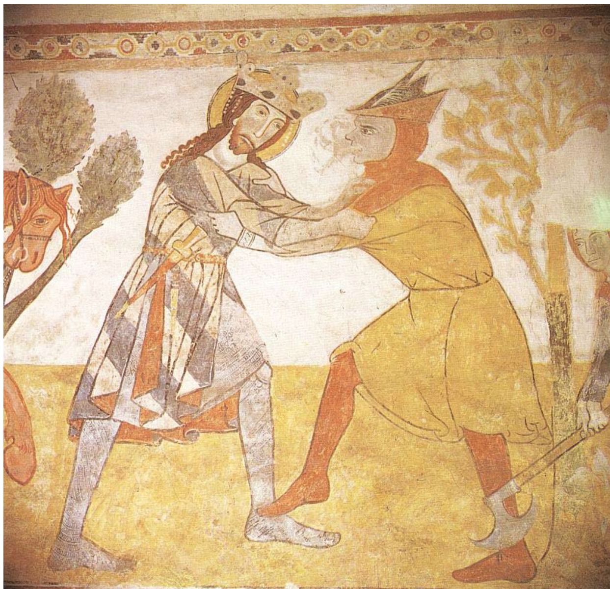
4. Tőrbrázolás a kakaslomnici templom Szent László-legendáján, 14. század eleje (László1993. után)