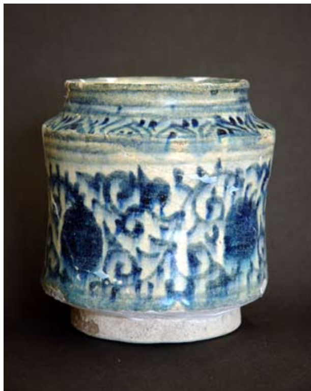
2. Az ornamentális díszű albarello

Az emésztőt szinte teljesen feltöltötte a konyhai hulladék: különféle állatsontok, tojánhéjak, halpikkelyek, valamint a főző, tároló és asztali cserépedények darabjai. A palota berendezési tárgyainak maradványai, elbontott Zsigmond-kori kályhák töredékei mellett több, különleges lelet is akadt, például összetört Mátyás-kori lámpások és csillárok jól rekonstruálható töredékei. 1 A lelőhely rendkívül sok információt szolgáltatott az egykori királyi udvar életről,