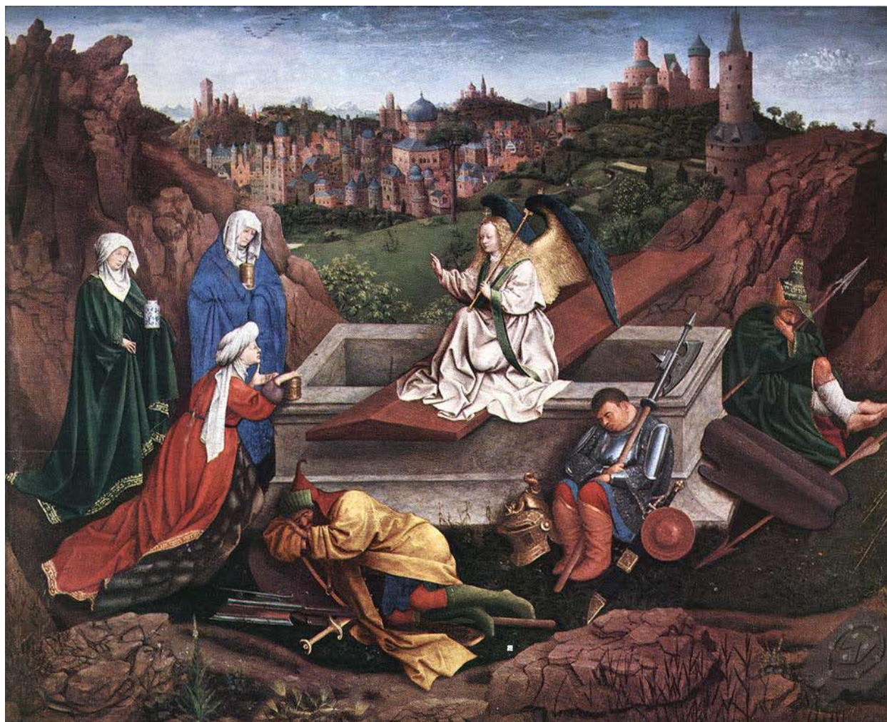
8. Majolika albarelló Hubert vagy Jan van Eyck: „A három Mária a sírnál” című képén

ban készülhetett a 14. században vagy a 15. század első felében, s valószínűleg Nagy Lajos vagy Zsigmond király uralkodása idején kerülhetett Visegrádra. A gondosan óvott díszedényt sokáig használhatták, igen hosszú időt élt meg, s csak a 15. század végén, Mátyás uralkodása idején került szemétre.