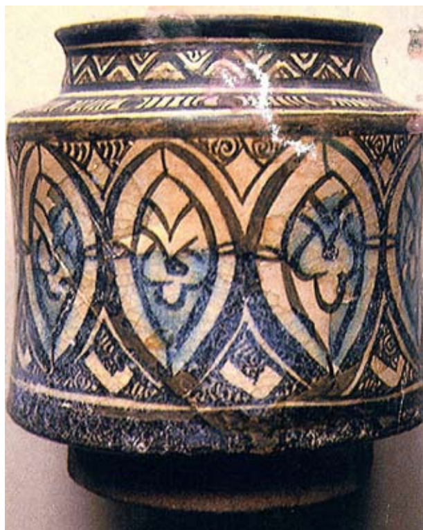
4. A geometrikus díszű albarelló

zamát egy a szíriai Hama-ban feltárt 14. századi csésze mag alakú mintájában fedezte fel, 5 de a mandorlák belsejében látható motívumra is egy hamai tál belsejében találhatunk analógiát. 6 Az albarelló nyakát díszítő cikkcakkos minta, valamint a feketével kirajzolt térkitöltő elemek is gyakoriak 14. századi szíriai vagy az egyiptomi Kairó egyik városrészéből, Fuszatból származó díszedényeken. A mandorlák sorával dekorált edénytest és cikkcakk festéses válldíszítés Szíriában élő hagyományát igazolja egy másik, 13. századi albarelló is (5. kép). 7