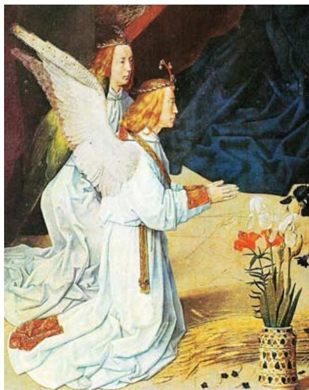
10. Valenciai albarelló Hugo van der Goes 1479-es Portinari oltárképén

Az albarellókat patikaedényként, tégelyként használták, gyógynövényeket, orvosságokat, kenőcsöket tartottak bennük. Hispániában és Itáliában a 14 - 15. században nagy számban használták e célra ezeket az edényeket. Lehet, hogy a magyar udvarban is orvosságos tégelyként hasznosították őket, de a tárgyak különleges, keleti import áruk lévén, dekorációként, esetleg virágvázaaként is szolgálhattak. Magyarországon Mátyás korából tudunk királyi patikáról, az ő budai udvarából maradtak fenn az egykori gyógyszertár értékes tárolóedényeinek töredékei. A patika felszerelése nem volt egységes, sokféle alakú, különféle eredetű edény kapott helyet benne, a felirattal ellátott, díszes példányoktól az egyszerűbb kivitelű, fehér ónmázás darabokig, a drága itáliai és hispániai import kerámiáktól a hazai készítésű majolikáig. 21