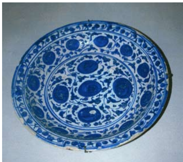
6. 15. századi perzsa tál a Louvre kiállításán

zetése is hasonlít kissé a visegrádi darabhoz, de az indák rövidebbek, leveleik húsosabbak.