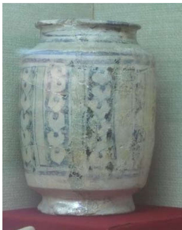
7. 14. századi majolika albarelló Damaszkuszban, az Arab Orvostudomány Múzeumának kiállításán

Mindkét Visegrádon talált albarelló készítés technikája közel-keleti eredetre vall, és bár a Szíriában és Egyiptomban készült kerámiákat ebben a korszakban nem nagyon lehet megkülönböztetni egymástól, 16 mintakincsük, párhuzamaik alapján inkább Szíriában, azon belül is Hama-ban készülhettek. A geometrikus motívumú orvosságos edény jellegzetesen közel-keleti, hagyományos mintájú, 14. század első felében készült darab, amely a Nagy Lajos-kor elején juthatott el Magyarországra, és 1360 körül dobták ki törötten. Az indás - virágos díszű albarelló színezésében már a kínai porcelán, mintázatában pedig perzsa díszítőelemek hatását is mutatja, díszítésének stílusa kissé későbbi jellegű. Anyaga és analógiái szerint ez is Hama-