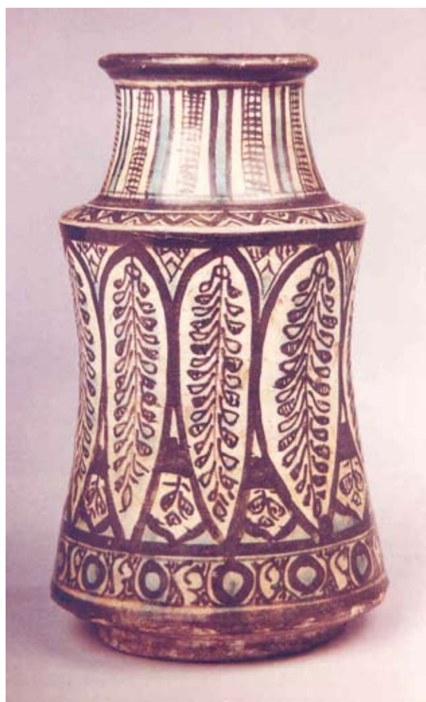
5. 13. századi szír albarelló (Fehérvári Géza nyomán)

az edénytest közepén található ovális foltok, - feltehetően virágok – amelyeket vékony, szétterülő leveles indák öveznek és kötnek össze. A virágminta előzményei iráni eredetűek lehetnek. Kerek foltként ábrázolt virágokkal és leveles indákkal díszített, szuzai eredetű tál látható a Louvre kiállításán a 15. századra keltezve (6. kép). A rózsabimbószerű virág szirmai sötétebb kékkel vannak kirajzolva az indigókék alapon. 8 Hasonló tálát ismerünk a perzsi Meshedből is. 9 Az indigókék festésű tál típus készítési idejére egy az Ermitázsban őrzött, felirata szerint 1473-74-ben készült analógia adhat támpontot. 10 A perzsi tálak leveles indáinak vonalve-