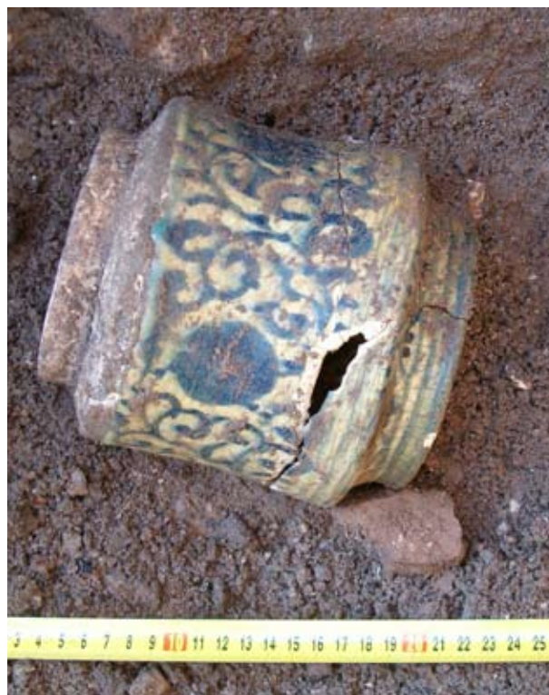
1. Az ornamentális díszű albarello megtalálása

ről, a konyha és az ebédlőtermek használati tárgyairól, berendezéséről.