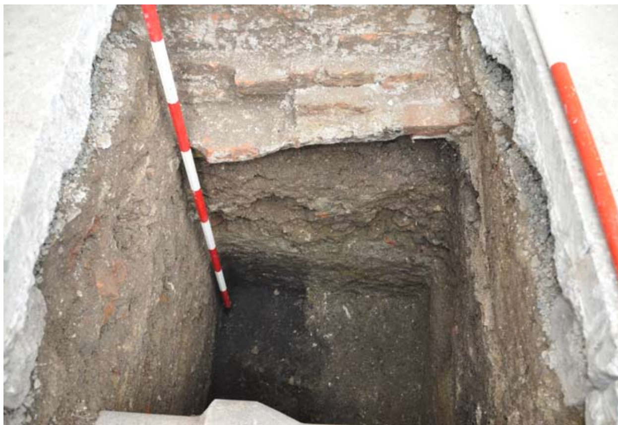
7. A 2011/3. árok feltárása déli irányból