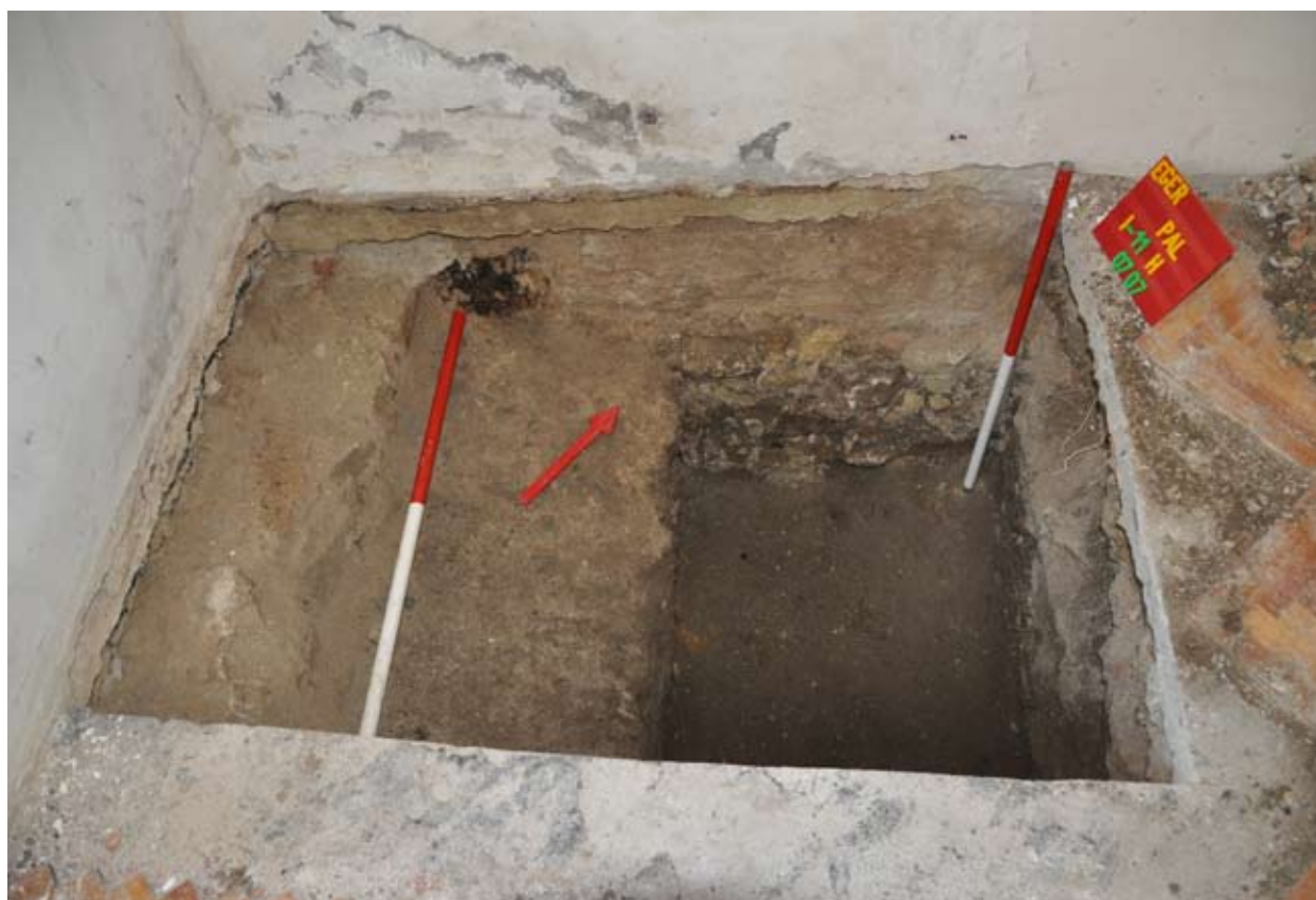
10. A palotaépület I-11.helységében kialakított szonda feltárás közben

zetéhez tartozó gerenda – vagy más fa maradványához tartozott. Ennek környékén megtaláltuk az objektum korabeli beásásának nyomát, egy további abroncsot pedig közvetlenül a D-i metszetsfal közvetlen közelében figyeltünk meg. Eredeti funkcióját tekintve minden bizonnyal vas abroncsokkal és hengerekkel körbepántolt fa vízvezeték lehetett. Az itt megfigyelt betöltésben koraújkorai-újkorai jellegű kerámiát és állatsontokat találtunk. Elsődleges vizsgálatuk alapján a kérdéses „csatornát” legkorábban a 17. század végén vagy a 18. század első felében helyezték a földbe.