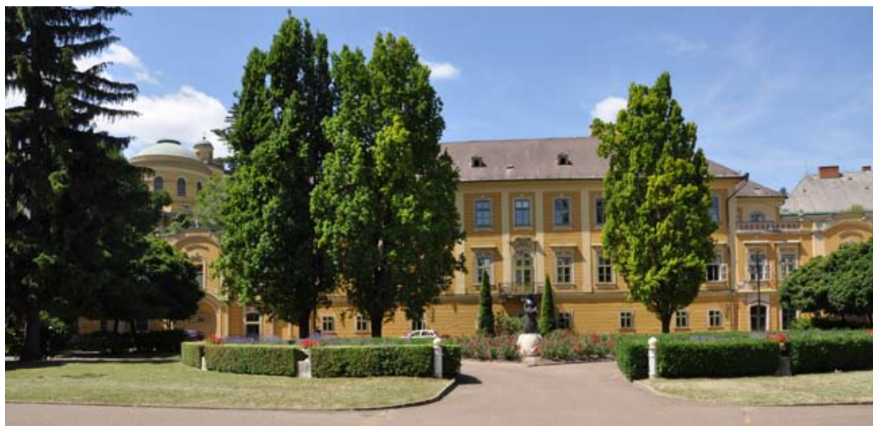
1. Az ásatási terület: Eger, Érseki Palota, kert

A 2011/2. árok az előzőtől D-re, szintén az épületre merőlegesen húzódott, 18,20 m hosszan, 1,40 m szélességben, mélysége 0,95 – 1,70 között váltakozott. DNy-i végében találtuk meg a fentebb már említett barokk kori külső járószintet, ettől K-re 1,40 m mélyen gazdag török kori – koraújorkori leletanyagot (bosnyák sütőtál,