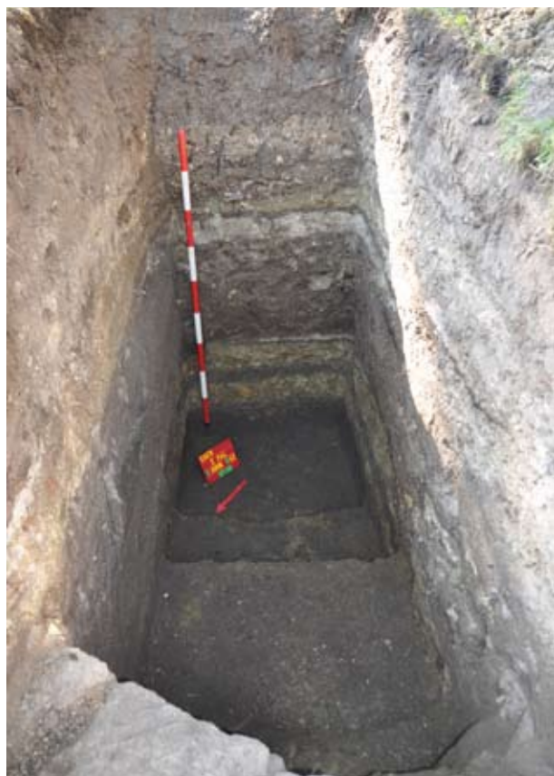
8. A 2011/3. árok 3. szonda betöltési rétegei kibontás után

2. szondát ástuk ki, 1,20 m szélességben, 2,50 – 2,70 m mélységben. Itt is előkerült a fentebb már említett sötétbarna réteg, amelyből szintén Árpád-kori – elsősorban korai – cseréptöredékeket gyűjtöttünk.