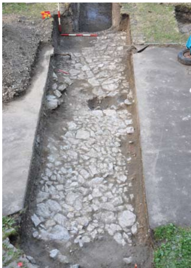
4. A 2011/1. árok nyugati fele tisztítás után

pipák, érmek, vastárgyak, nagy mennyiségű kerámia, ólom astragalus) tartalmazó betöltés húzódott amelynek É-i szélét találtuk meg. Erről az objektumról feltételeztük, hogy gödör vagy beásás lehet, azonban a későbbiekben kiderült, hogy feltehetően egy itt húzódó 17. századi ház részlete. Az árok ÉK- i oldalán 1,40 – 1,50 m mélységben 4 db. viszonylag szabályos kőtömb bontakozott ki egymáshoz közel azonos távolságban. Ezek talán „fachwerk” szerkezetű épület talpkövei lehettek. 1,50 m mélységben az ároknak ezen a szakaszán a kövek körül mindenütt sárga agyag, erősen letaposott felület bontakozott ki, amely – a felszínbe mélyedő cölöp- és karólyukak alapján is – az egykori épület belső járósíntje lehetett. Erről a felületről és a közvetlenül felette húzódó, részben égett, faszenes betöltésből további nagy mennyiségű, a korszakra datálható kerámiatöredék került elő. A leletek és jelenségek előzetes vizsgálata alapján feltehető, hogy az épület a 17. század második felében, végén pusztulhatott el. Azt is valószínűsíthetjük, hogy egy nagyjából K-Ny-i