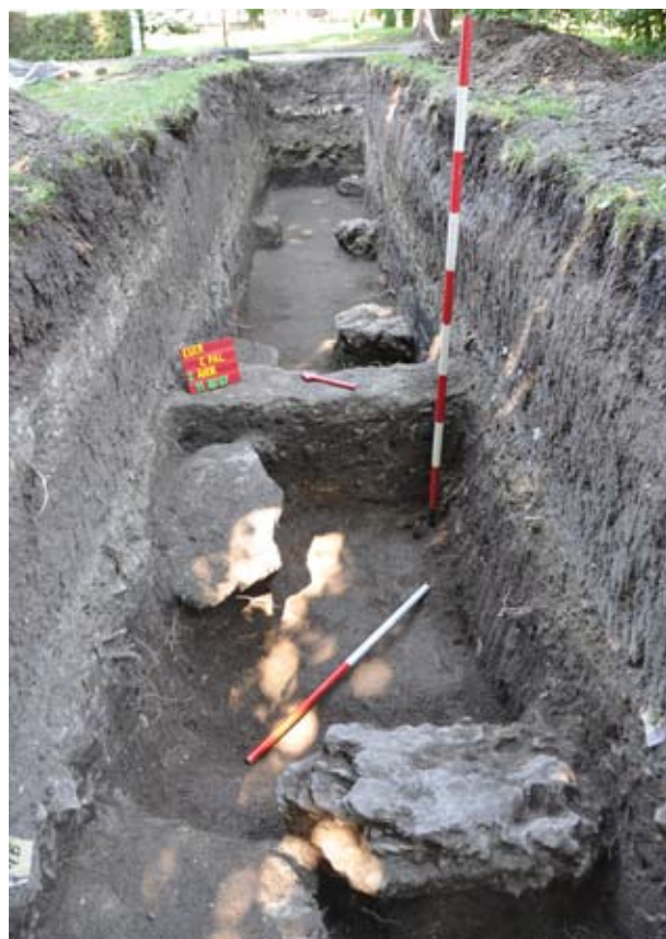
5. A 2011/2. árok nyugati irányból

A 2011/3 – 2011/4. árok a 2011/1-2. árkok között, azokra merőlegesen, egymástól 1,5 m-re húzódott. A 2011/3. árok 9,70 m hosszú, 1,60 m széles volt, mélysége 0,5 – 2,20 m között változott. A 2011/3-4. árkok elválasztó tanúfalakat egy 1 m-es szakaszon egybebontottuk. Itt is előkerült a fentebb már említett 18. századi járósínt. Közvetlenül ez alatt, 1 m-es mélységben a 2011/3-as árokban egy 1-60- 1,80 m széles, ferdén húzódó (ÉNy-DK-i irányú) nagyméretű kövekből kirakott kőfelületre bukkantunk, amely közvetlenül az alatta húzódó riolittufa szinten ült. Ezt az itt kialakított 2011/3. árok / 3. szonda É-i metszetében figyeltük meg. Szintviszonyai alapján biztosan nem a barokk korra keltezhető, a környezetéből előkerült leletek alapján valószínűleg török kori, 16 – 17. századi. Kialakítását tekintve (enyhén domborodó, két oldala felé lejt) talán külső járófelület lehetett. Biztosan nem falalapozás, az árok metszetében és a felület feletti betöltésben nem találtunk visszabontásra utaló kötörmelékot, kősfírat