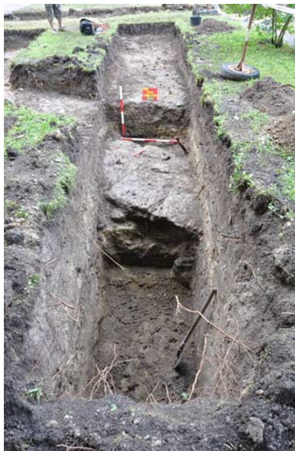
6. A 2011/1. árok 1. szonda betöltési rétegei keleti irányból

A 2011/3. ároktól Ny-ra, az épület felé a 3. árokkal párhuzamosan húztuk ki a 2011/4. árkot 9,90 m hosszan, 1,60 m szélességben, mélysége 0,55 – 2,20 m volt. A már említett 18. századi kőburkolaton kívül egy téglával körberakott közmű-vezeték (talán használaton kívüli) került az árokból elő, átlagosan 0,60-0,70 m mélyen, leásásával részben bolygatták a barokk kőfelületet. Az árok D-i végében a 2011/4. árok /