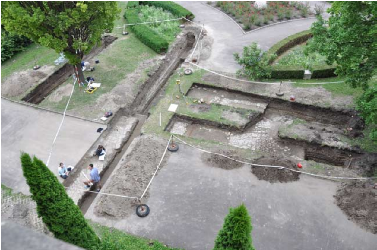
2. A 2011/1., 3-4 és 5. árkok tisztítás és dokumentálás után