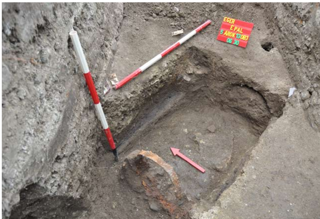
9. A 2011/5. árokban előkerült csatorna nyugati irányból

A tervezett építkezéssel érintett területen a 2011/1. ároktól É-ra húztuk meg a 2011/5. árokot, az 1. árokkal párhuzamosan. Hossza 10 m, szélessége 1 m, mélysége 1,50 – 1,90 m között váltakozott. Régészeti korú objektum e helyről három került elő: közvetlenül az árok DNy-i végénél 16-17. századi leletanyagot tartalmazó, részben égett folt bontakozott ki; az árok túlsó oldalán (ÉK-i rész) hasonló korú leleteket tartalmazó „beásást”(?) vagy betöltődést találtunk. Az előbbiről kiderült, hogy az egy – leletei alapján 16 – 17. századi - pusztulási réteg. A kettő között az árok középtáján 1,10 – 1,20 m mélységben egy pontosan K-Ny-i tájolású objektumot bontottunk ki, amelynek két szélén szenült fa maradványokat, középtáján pedig erősen korrodált vas abroncsot tisztítottunk le. A szenült, égett jelenség a fentebb említett pusztulási réteghez, nem az objektum szerke-