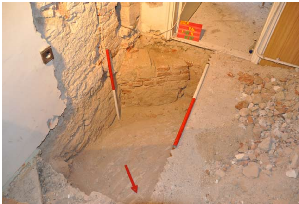
11. A palotaépület I-12.helységében kialakított szonda feltárás közben